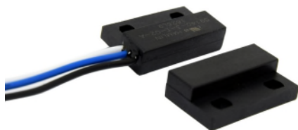
Contatto porta magnetico

Solo Store RP - Griglie maggiorate per l'installazione in serie delle barriere d'aria colore standard RAL 9010 o tinta naturale alluminio.