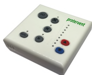
comando remoto HP bxpxh 85x85x32 mm